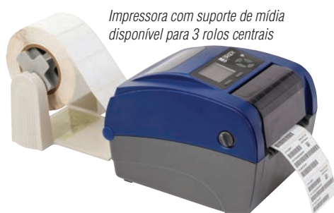
Impressora com suporte de mídia disponível para 3 rolos centrais