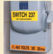
Identificador de Painel e Disjuntor