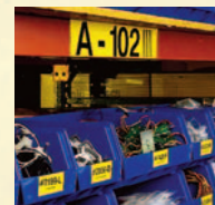
Identificação de Compartimentos e Prateleiras