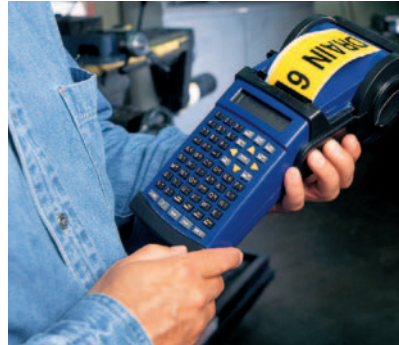
HandiMark®, vai aonde você vai!