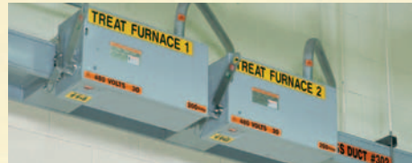
Identificador de Condutor Geral/Duto