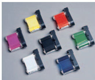
Ribbons Industriais para a HandiMark® disponíveis em sete cores.