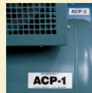
Identificação de Equipamento