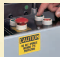
Etiquetas de Advertência