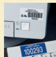
Identificação de Ativos