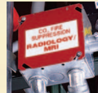
Gaixas de Distribuição